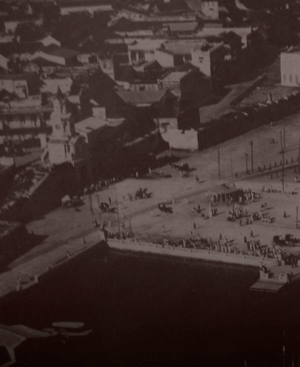
información de la imagen: origen. Archivo. año. etc.